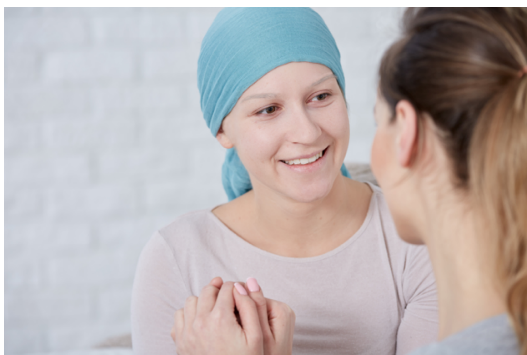
Spezialsprechstunde Onkologie: Ernährungsberatung und Ernährungstherapie für Patienten mit Krebs oder Mangelernährung